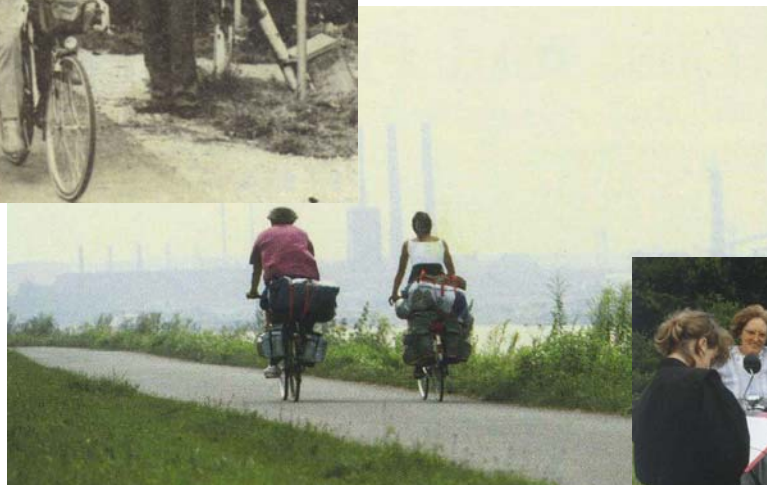
1990: 1. Radgäste- Befragung an der Donau“