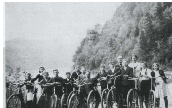
Donau-Radtourismus einst - Zwischenkriegszeit